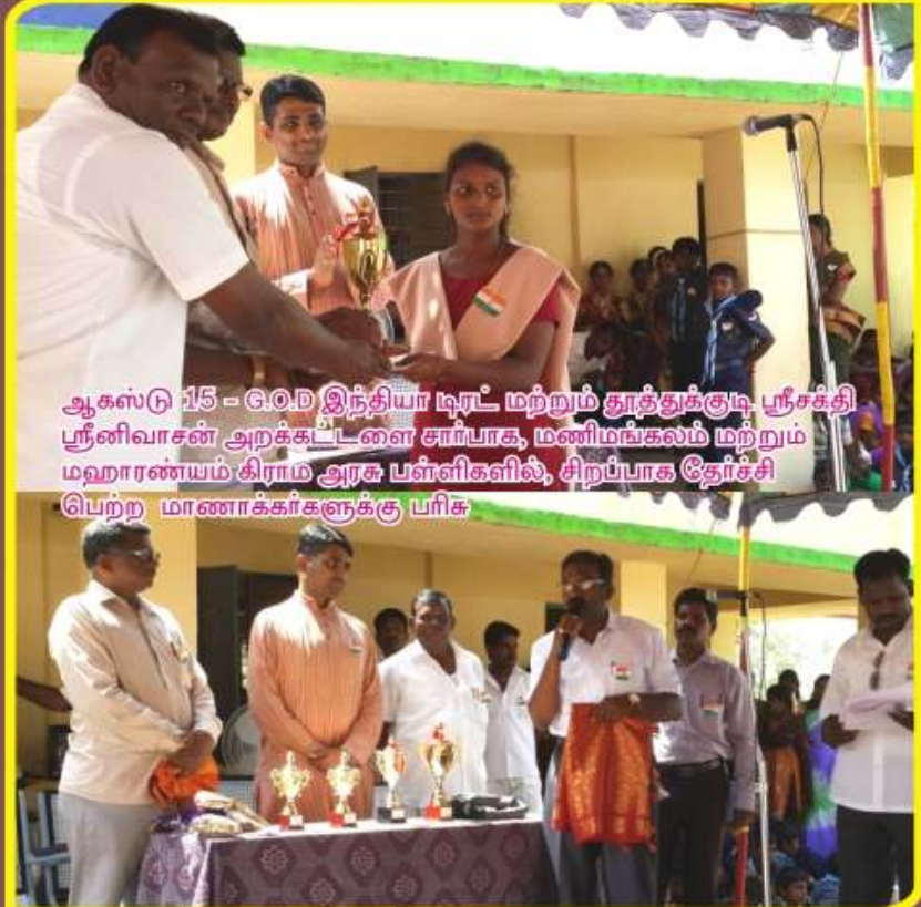
ஆகஸ்டு 15 - G.O.D இந்தியா டிரட் மற்றும் தூத்துக்குடி ஸ்ரீசக்தி ஸ்ரீனிவாசன் அறக்கட்டளை சார்பாக, மணிமங்கலம் மற்றும் மஹாரண்யம் கிராம அரசு பள்ளிகளில், சிறப்பாக தேர்ச்சி பெற்ற மாணாக்கர்களுக்கு பரிசு