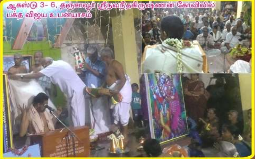
ஆகஸ்டு 3- 6, தஞ்சாவூர் ஸ்ரீநவந்திரிஷ்டணன் கோவிலில் பக்த விஜய உபன்யாசம்