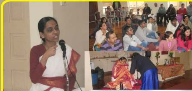
ஆகஸ்டு - ஆஸ்திரேலிய நியூசிலாந்து சதசங்கங்கள் பூர்ணிமாஜி