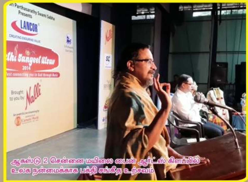
ஆகஸ்டு 2 சென்னை மயிலை பைன் ஆர்ட்ஸ் கிளப்பில் உலக நன்மைக்காக பக்தி சங்கீத உற்சவம்